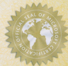
Steven A. Ballmer Chief Executive Officer

Has successfully completed the requirements to be recognized as a Microsoft® Certified IT Professional: Database Administrator 2008